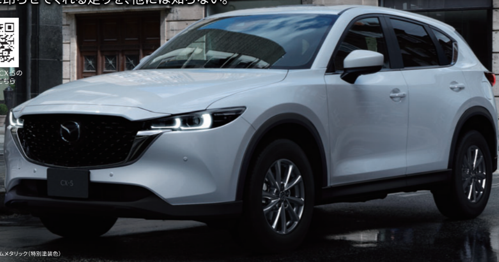
Body Color : ロソウムホワイトプレミアムメタリック(特別塗装色)