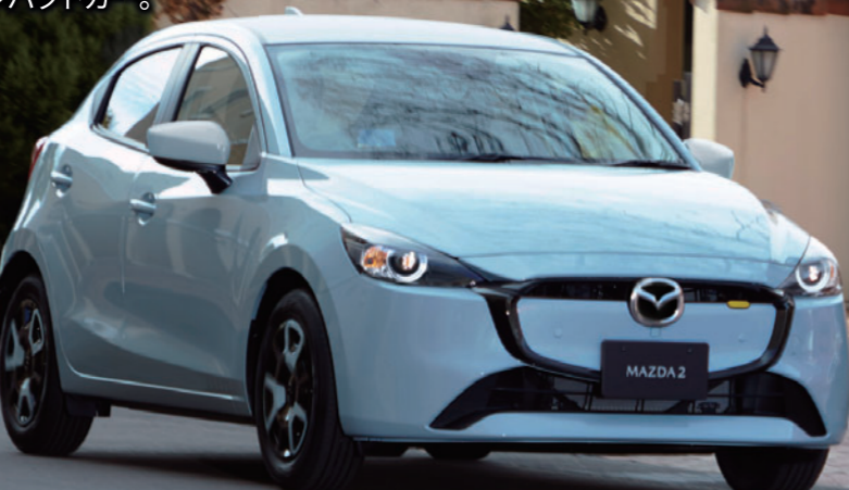
Body Color : エアストリームブルーメタリック