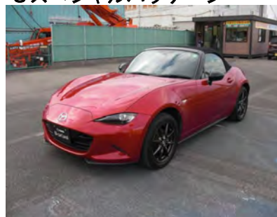
2016年 ロードスター Sスペシャルパッケージ