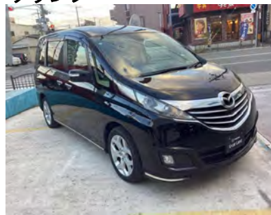
2012年 ビアンテ グランツ