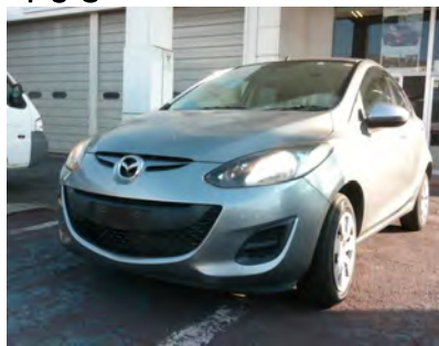
2014年 デミオ 13C