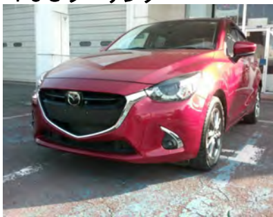
2018年 デミオ 15Sツーリング