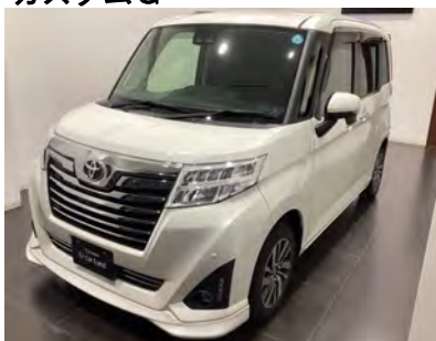
2019年 ルーミー カスタムG