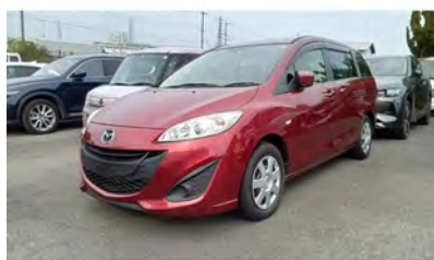
2013年 プレマシー 20C-スカイアクティブ