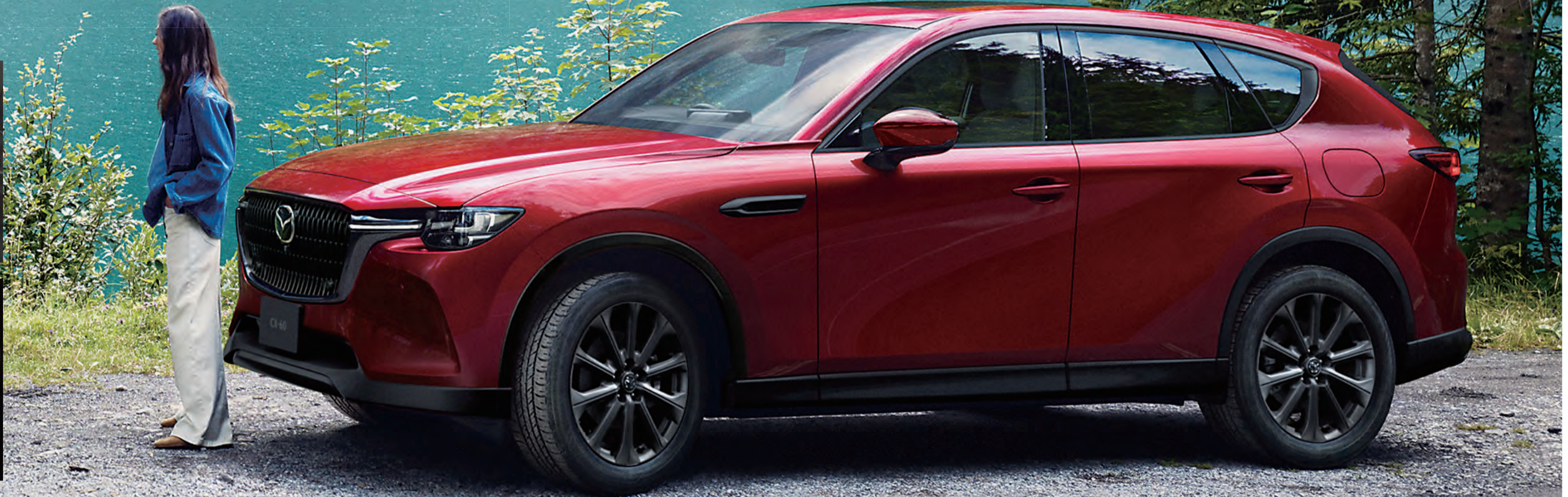
Body Color: ソウルレッドクリスタルメタリック(特別塗装色)