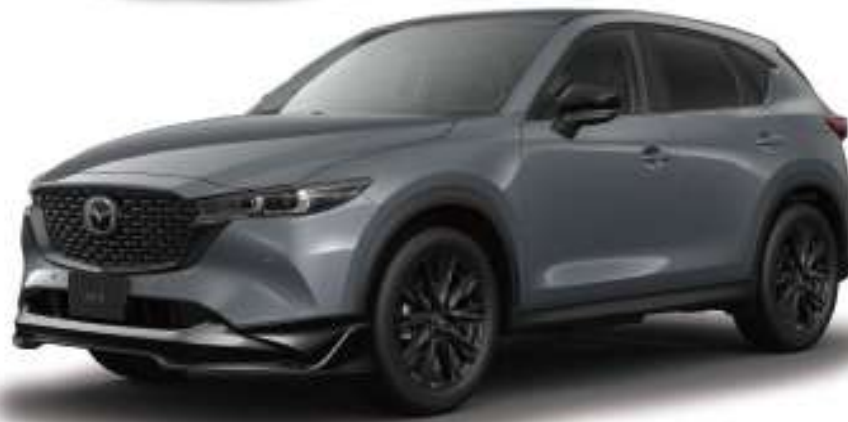
Body Color: ポリスタールグレースタリック