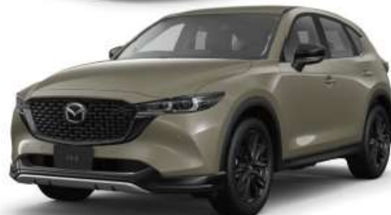
Body Color: シルコンサンダーメタリック