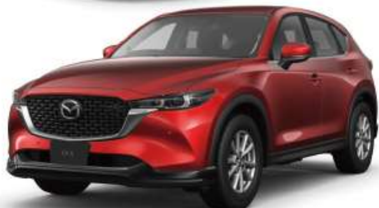
Body Color: ソウルレッドクリスタルメタリック(特別塗装色)